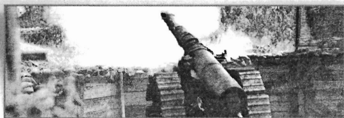
· GRANDE GUERRA · GRANDE GUERRA · GRANDE GUERRA ·